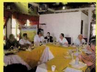
Reunión con Alcaldes y Gerente del SANAA