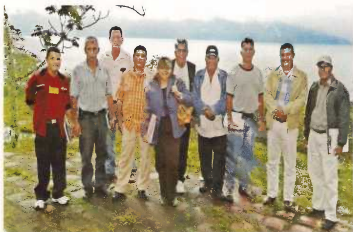
Miembros de la Cámara de Turismo del Lago de Yojoa