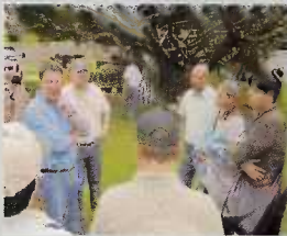
Conversatorio con el Presidente

El presidente del Congreso Nacional, Juan Orlando Hernández, realizó un recorrido por el Lago de Yojoa, para constatar la situación ambiental del mismo, y anunció una serie de acciones concretas en conjunto con otras instituciones del Poder Ejecutivo para salvar el ecosistema del monumento natural hondureño.