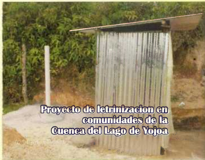
Proyecto de letrización en comunidades de la Cuenca del Lago de Yojoa

En toda la cuenca del lago Yojoa existe una gran problemática respecto a la gestión de las aguas negras. Aproximadamente 85,000 habitantes de las comunidades que rodean el lago no tiene un adecuado sistema de alcantarillado y los desechos producidos desembocan a través de las quebradas directamente al lago de Yojoa sin ningún tipo de tratamiento.