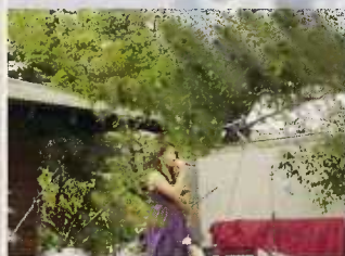
Presentación del elenco artístico en el Lanzamiento de la canción Lago de Yojoa Corazón de Honduras"