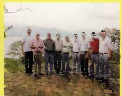
Alcaldes y Gerente del SANAA