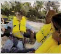
Recorrido por el Lago