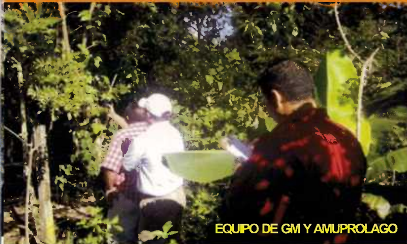
EQUIPO DE GM Y AMUPROLAGO

Toma coordenadas para la construcción de accesos al sitio donde se construirá el Centro de Tratamiento para los Desechos Sólidos