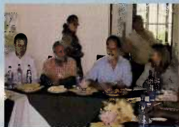
Reunión con Alcaldes y Ministro del FHIS

En este mismo tema de fortalecimiento municipal logramos obtener apoyo para la capacitación de un grupo de personas de la para convertirlos en capacitadores sociales, con lo que se estará brindando una oportunidad de trabajo a personas calificadas que viven en los municipios y que podrán ser parte de los proyectos ejecutados por la comunidad. A la vez está la oportunidad de aplicar a proyectos de energía solar con aporte de contrapartida municipal y del beneficiario.