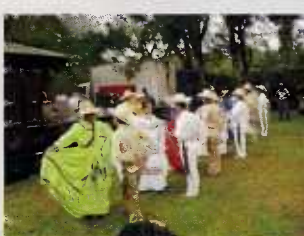
Presentación de cuadros artísticos previo al lanzamiento de la canción

En este trascendental evento se conto con la participación de las alcaldías municipales de Siguatepeque, Las Vegas, San Francisco de Yojoa, Santa Cruz de Yojoa, Ilama, Gualala y San Jose de Comayagua, las cuales forman parte de la Mancomunidad de Municipios del Lago de Yojoa. también estuvieron calorizando el acto La Asociación para la Investigación y el Desarrollo Socioeconomico (ASIDE) y La Escuela Nacional de Ciencias Forestales (ESNACIFOR) que son instituciones contrapartes del Programa para la Regeneracion Medioambiental del Lago de Yojoa.