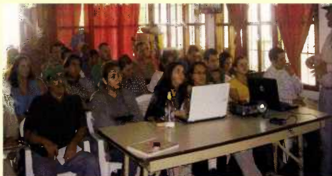
Parte de la audiencia en reunión con personal de la Fiscalía Especial Del Ambiente, AMUPROLAGO y Fuerzas Vivas del Lago de Yojoa

La problemática del Lago de Yojoa y las acciones puntuales a efectuar por institución fue analizada de acuerdo a los siguientes componentes: Manejo forestal; minería; pesca; acuicultura; gobierno municipal; biodiversidad; evaluación de impacto ambiental; ordenamiento territorial; turismo; agricultura; ganadería; seguridad; ministerio público y contaminación.