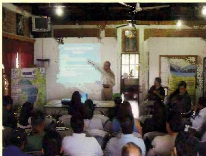
Fiscal del Ambiente realiza exposición sobre trabajo a realizar en la Cuenca del Lago de Yojoa en coordinación con AMUPROLAGO y Fuerzas Vivas de la zona.

El seguimiento a los compromisos adquiridos por componente y por institución, estará a cargo de la Fiscalía Especial del Medio Ambiente.