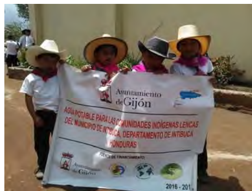
Celebración de finalización del proyecto.

Paralelamente, actividades de capacitación, sensibilización y concienciación e igualmente de promoción de la cultura lenca y empoderamiento de la mujer. Redacción de informes de seguimiento y de memoria final de justificación