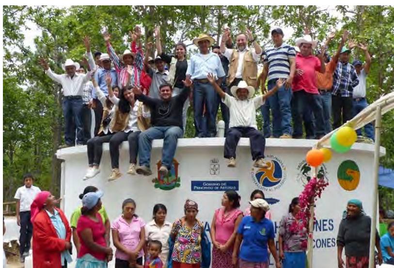
Inauguración de proyecto