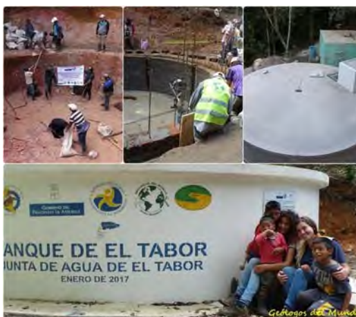
Depósito de agua semienterrado con capacidad de almacenamiento de 18.000 galones .

Comunidades rurales de etnia lenca de los municipios de La Esperanza, Intibucá y Yamaranguila, todos ellos del Departamento de Intibucá, con ausencia o fuerte deficiencia de abastecimiento de agua potable. Tras la visualización y análisis de los perfiles aportados por las propias comunidades y las correspondientes municipalidades, se opta por la actuación en cinco (5) comunidades rurales: El Tabor , El Ciprés, Monquecagua, La Sorto (Intibucá); tres barrios periféricos de La Esperanza e Intibucá: El Tejar y San Carlos (La Esperanza y Las Delicias (Intibuca); y en un jardín de niños del Barrio de San Carlos.