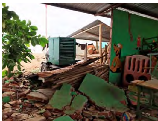
Daños en la escuela después del terremoto.

Colocación de caña picada (pintada interior y exteriormente) para obstaculizar el ingreso de ruido y polvo desde la calle a las aulas. Arreglo de fisuras menores en los muros mediante corchados con masilla de cemento gris. Las fracturas de mayor carácter fueron cosidas con grapas metálicas cada 30 cm y recubiertas con mortero de cemento gris. Construcción de muros de separación de aulas. Cambio de la estructura del techo de 3 aulas. Reparación de baños. Colocación de puertas en las aulas.