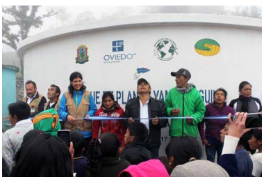
Inauguración del depósito de agua finalizado en Yamaranguila.