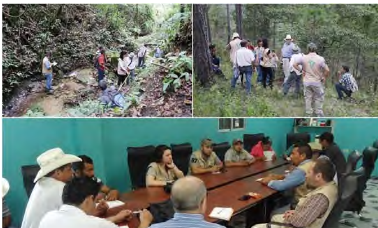
Reuniones y trabajo de campo