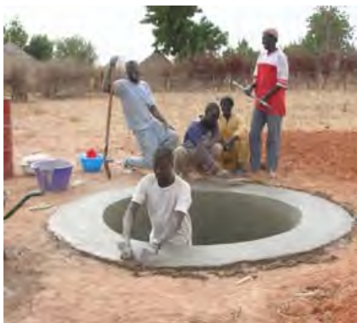
Construcción de la estructura del pozo.

Siendo una región árida, la región de Kaolack se enfrenta desde hace muchos años a un problema crucial de suministro de agua potable a su población. El suministro de agua potable para el consumo en Kaolack ciudad se ve afectado por la calidad del agua, con una concentración de minerales muy elevada, en particular el flúor.