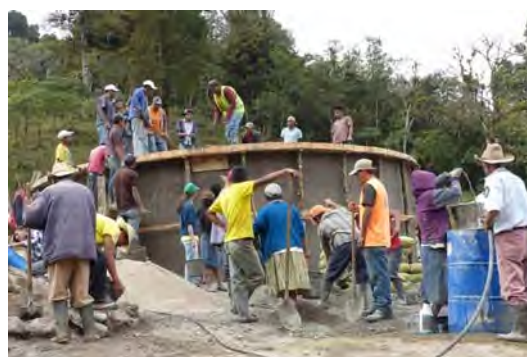
Construcción de tanque de almacenamiento de agua potable

Paralelamente, actividades de capacitación, sensibilización y concienciación e igualmente de promoción de la cultura lenca y empoderamiento de la mujer. Redacción de informes de seguimiento y de memoria final de justificación