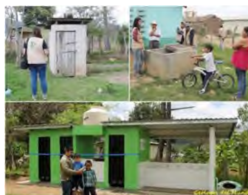
Centro educativo Nuevo Amanecer y los Jazmines, en Anita, antes y después de la construcción de tres módulos sanitarios.