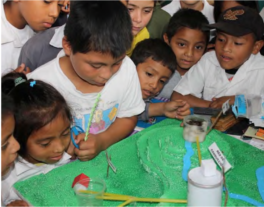
Foto portada: Exposición de trabajos de un taller de educación ambiental en centros escolares de Intibucá, Honduras, tema "El agua, fuente de vida. Consecuencias de su contaminación" .

Foto portada interior: Toma de agua y filtrado. Portillo del Norte, Honduras.