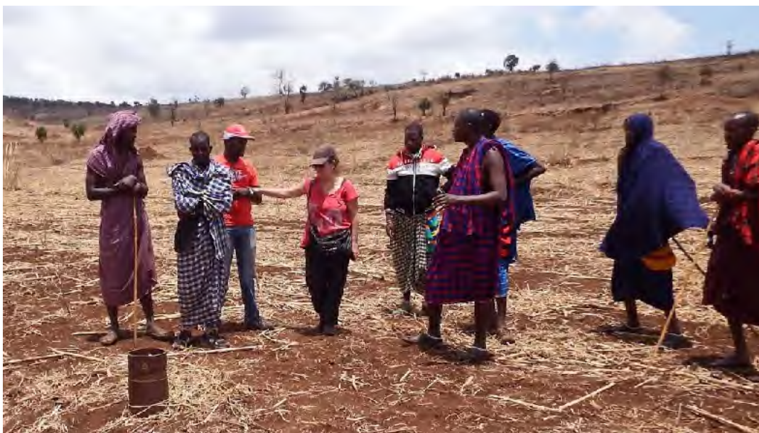
Reconocimiento de la zona de trabajo, guiados por personal de la fundación Eretore.

Se mantuvo también una reunión con el líder de las aldeas, (Diwani) que, interesado por la posibilidad de mejorar el abastecimiento de agua, ofreció todo el apoyo "institucional" posible.