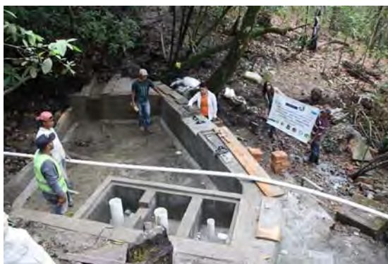
Construcción de obra toma

Además de ello, Redacción de informes de seguimiento y de memoria final de justificación.