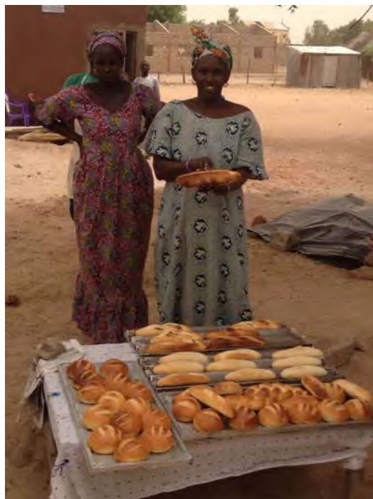
Presidenta de la Agrupación de Mujeres de Gapakh con vestido azul. Productos elaborados.