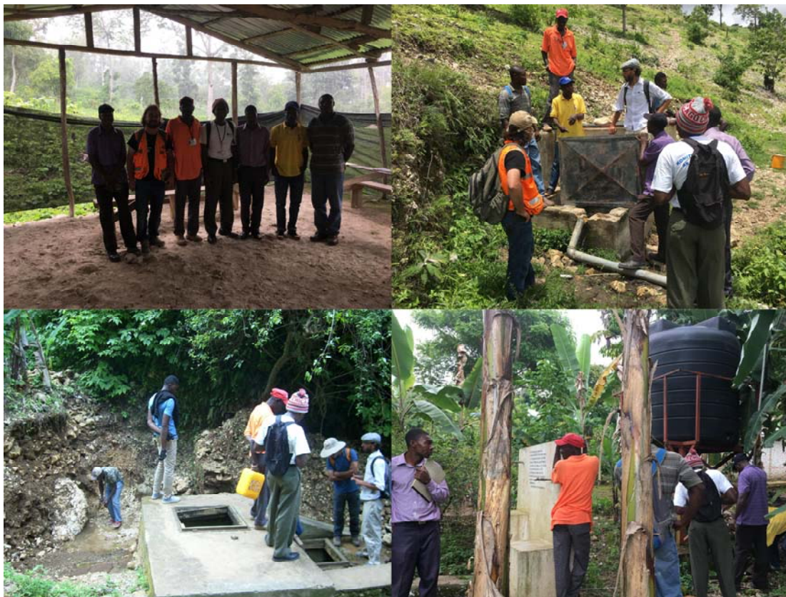
Reunión con los miembros de la CAEPA y la APFJ e inspecciones en diferentes puntos del sistema de abastecimiento de agua.

Visita a la ciudad haitiana fronteriza de Anse-a-Pitè, así como a los campos de refugiados y poblaciones rurales situados dentro de la misma municipalidad. Analizar el estado en el que se encontraban las obras de abastecimiento de agua realizadas por la Cruz Roja Alemana en Las Comunidades rurales de Plaine Mahot, Fond Jeannette y Terre Froide en Bois D'Orme, así como identificar necesidades y contrapartes para la formulación y realización de proyectos en la zona.