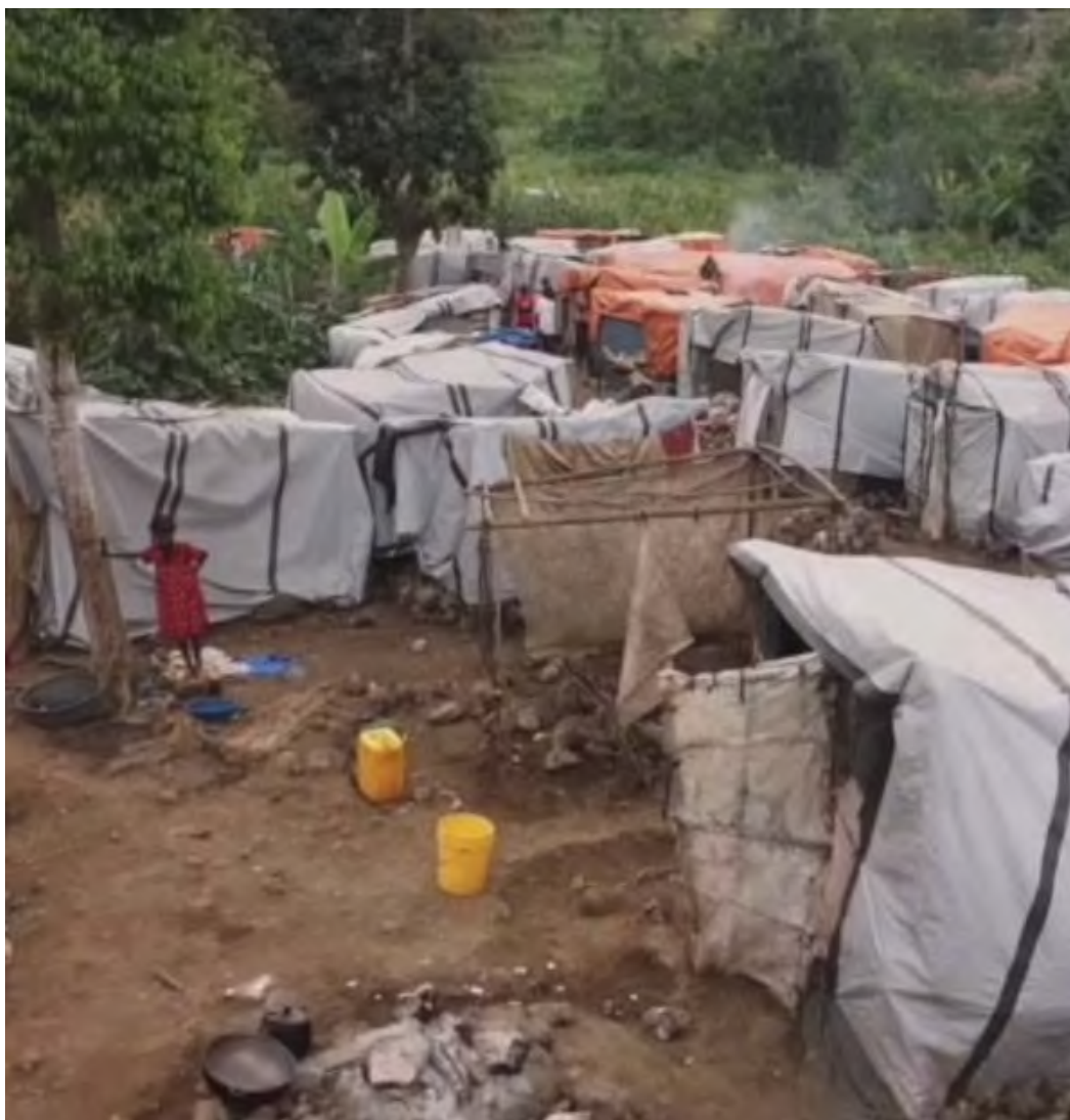
Campo de refugiados haitianos, sin letrinas.