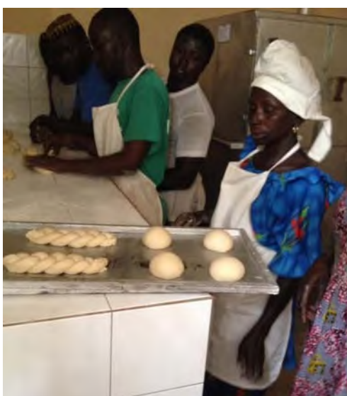
Interior de la caseta-panadería.

Actividades: Construcción de un depósito de producción de biogás y una caseta-panadería que funciona con dicho combustible. Para la producción del biogás se aprovechan los excrementos del ganado cercano. Posteriormente, los desechos de la planta son reutilizados para la producción de fertilizantes. De esta manera, se puede producir el pan para el pueblo sin consumir leña, que es escasa en el entorno y cuyo uso continuado produce deterioro en el entorno. La planta está situada, convenientemente, a unos metros de un abrevadero de vacas y, al aprovechar sus residuos, se resuelve también el problema sanitario relacionado con sus excrementos.