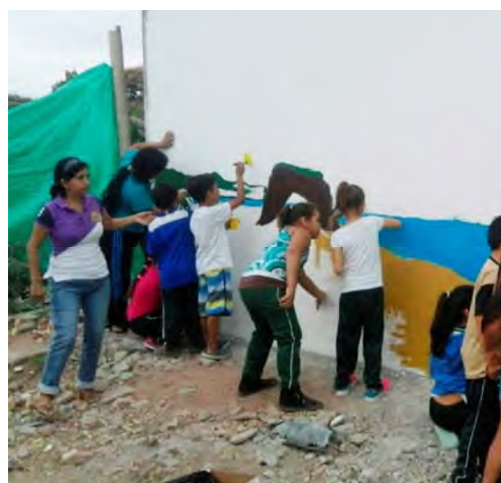
Colaboración de los niños de la escuela en la decoración de la infraestructura terminada.