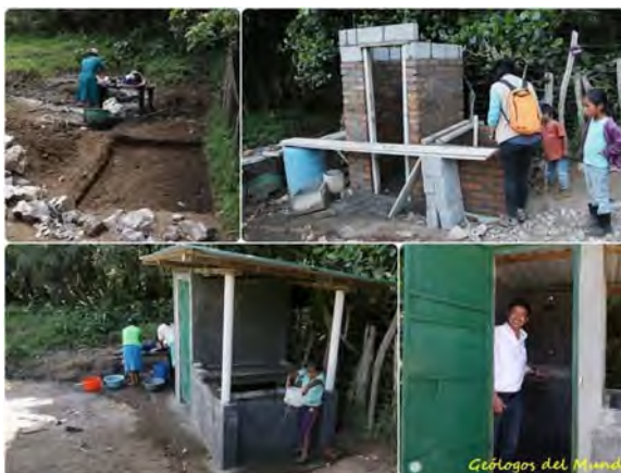
Construcción de módulo higiénico, de ducha y pila de agua.

Mejorar los sistemas de abastecimiento de agua potable, facilitando el acceso a ella en los hogares de las comunidades intervenidas, así como al desarrollo en las condiciones sanitarias básicas. Se ha contribuido, además, en el empoderamiento de la etnia indígena Lenca y de las mujeres, con el objetivo de ensalzar su papel en la sociedad hondureña