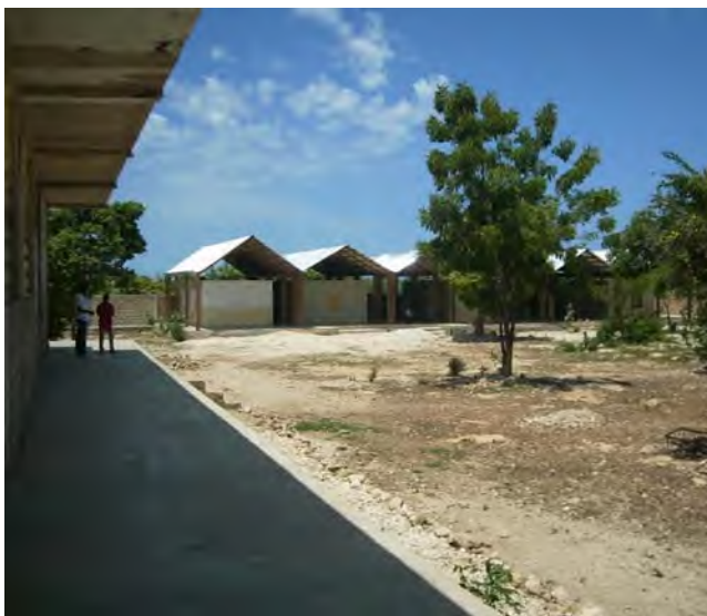
Vista de las casas construidas.