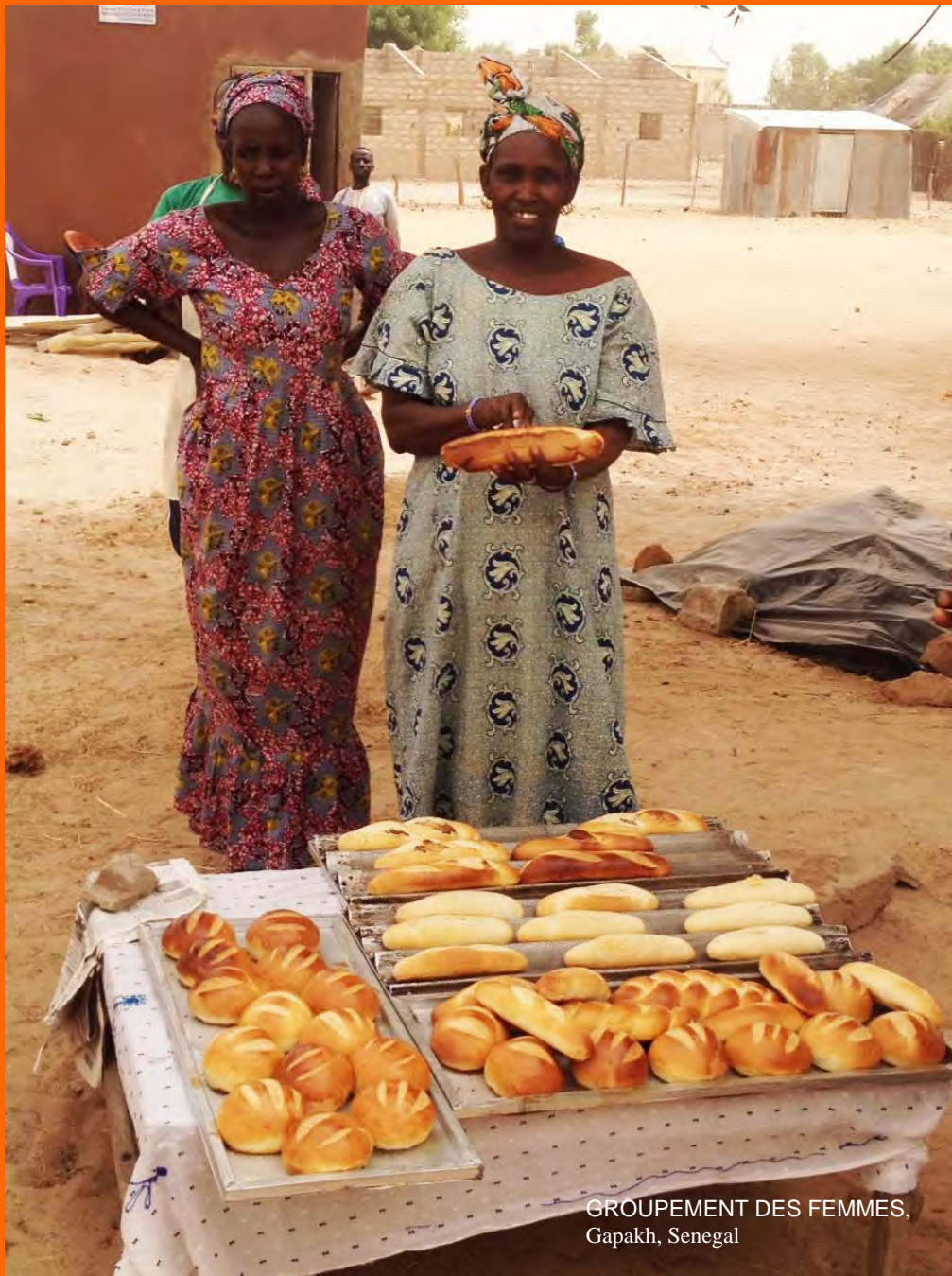
GROUPEMENT DES FEMMES, Gapakh, Senegal

Sé el cambio que querrias ver en el mundo.