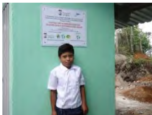
Niño en un módulo sanitario con la placa oficial.

Redacción de informes de seguimiento y de memoria final de justificación.