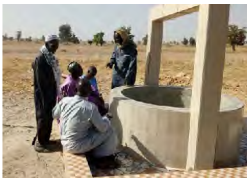
Inauguración del pozo finalizado.

Actividades: El trabajo manual de pozo suele ser posible en zonas en que tierra es de arena como el caso de las tierra en la aldea de KEUR OUMAR KHOUDJA, y también a poca profundidad (30m).