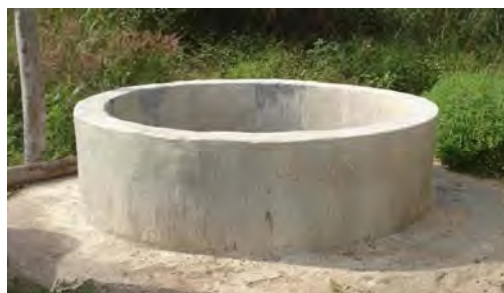
Estructura del pozo terminada.