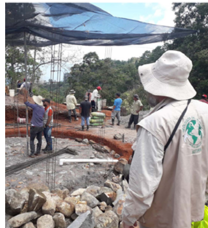
MEMORIA DE ACTIVIDADES 2020