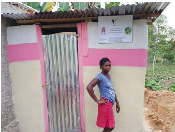
Vista frontal de una de las letrinas construidas con el cartel de agradecimiento al Ayuntamiento de Coslada