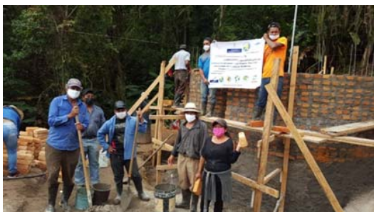
Construyendo cisterna de bombeo

Construcción de obra toma, cisternas de bombeo, acometida eléctrica, instalación de sistema de bombeo, construcción de depósito de almacenamiento. Como complemento, actividades de organización comunitaria, formación, capacitación, medioambientales todas ellas con enfoque de derechos y género.