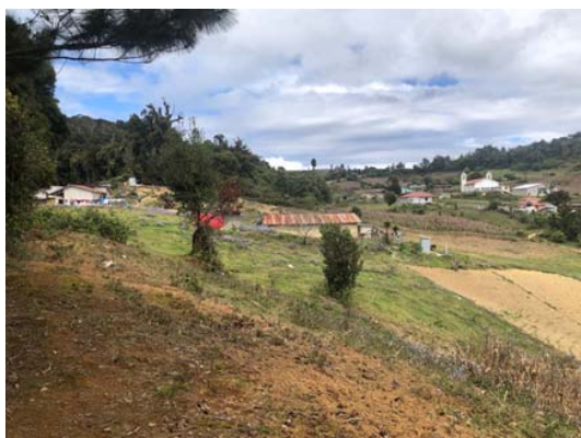
Aspecto de el sector Rodeo Centro.

Construcción de obra toma, cisternas de bombeo, acometida eléctrica, instalación de sistema de bombeo, construcción de depósito de almacenamiento. Como complemento, actividades de organización comunitaria, formación, capacitación, medioambientales todas ellas con enfoque de derechos y género.