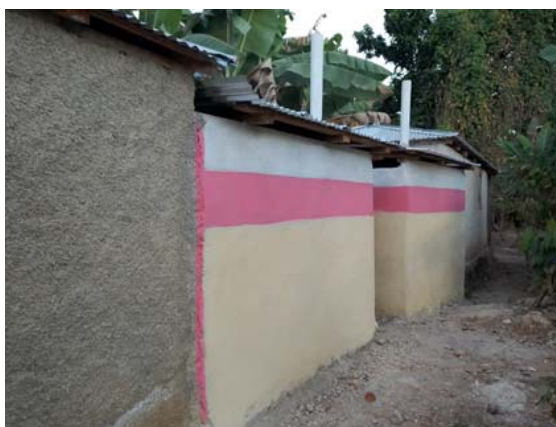
Vista desde atrás de dos de las letrinas construidas

Se han levantado 6 construcciones en el nuevo barrio de desplazados para aseo y letrinas durante el año 2020, dando solución a una de las mayores problemáticas que tenía la zona. Han intervenido constructores y mano de obra local, así como participado activamente la población de Fond Jeannette.