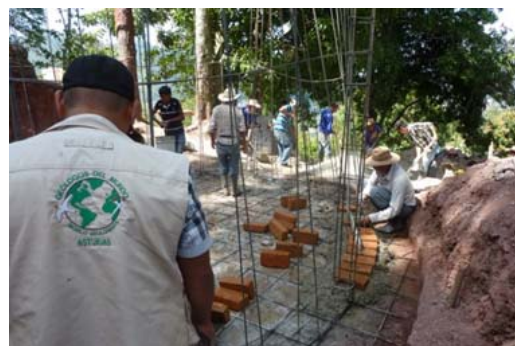
Inicio de construcción de un tanque de abastecimiento de 13.000 galones.

Se trabajó en 3 comunidades de la zona de Rio Blanco (Intibucá) con la construcción y mejora de sus sistemas de abastecimiento de agua y en el centro educativo Elden Vasquez con la construcción de sus sistema de saneamiento básico.