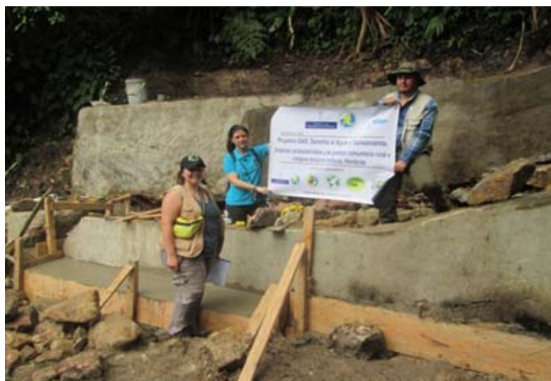
Construcción de obra toma en la comunidad de Valle de Ángeles