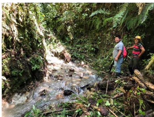
Agua que será captada y bombeada hacia la comunidad.