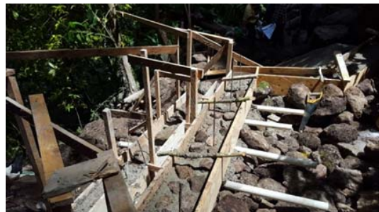
Construyendo obra toma