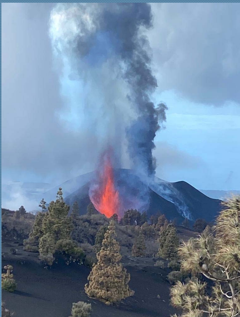
Volcán Cumbre Vieja, noviembre 2021