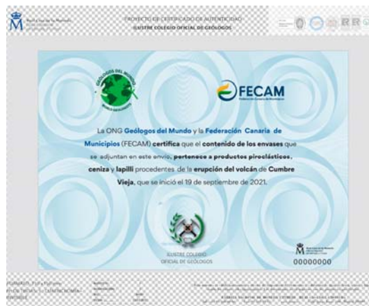
Certificado de autenticidad emitido por la Real casa de la Moneda

Actividades de divulgación y sensibilización en los medios escritos y digitales, radio y televisión, así como charlas en colegios y otras instituciones, por parte de integrantes de la Junta Directiva y técnicos de GM, con objeto de educar a la población, sobre este fenómeno natural y sensibilizar a los ciudadanos en general y a instituciones públicas y privadas, para recaudar fondos de ayuda para la población afectada.